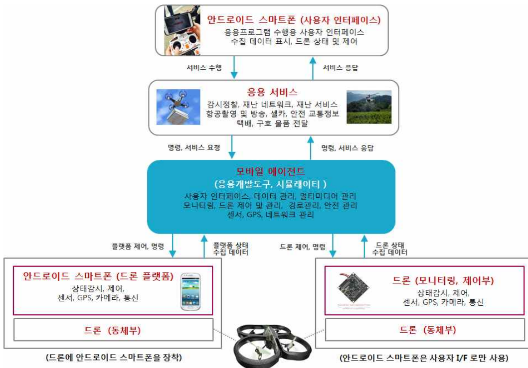
그림1. 드론 시스템 구성도